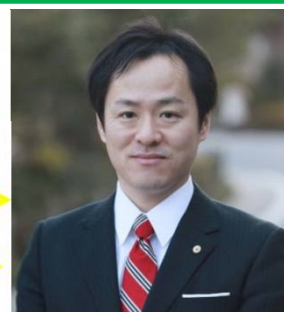
社会保険労務士 山田事務所